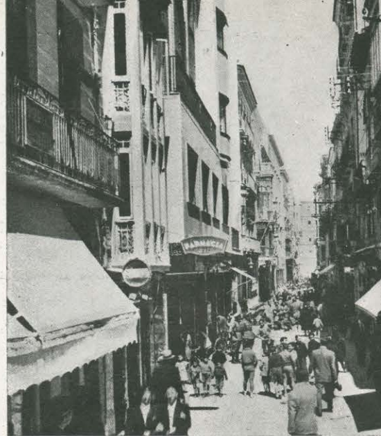
En varias ciudades españolas existen estas calles-paseo de peatones. Es la más popular y conocida la calle Sierpes en Sevilla. Y lo son asimismo las de Traperías y Platerías en Murcia.

el curso de las obras, se ha apreciado una disimetría que posiblemente, de haberse conservado, dejando una acera pequeña, una calzada y una acera grande, hubiera sido una solución práctica y eficaz.